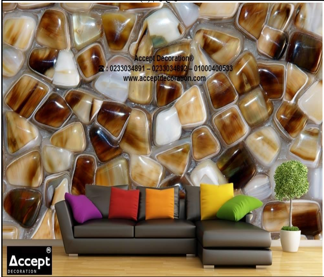
نموذج رقم (6)

نموذج رقم (6):- شكل هذا النموذج نوعا من الحداثة والذي ابتعد عن المألوف من خلال استخدام ورق جدران يمثل الأحجار الكريمة باللون الأبيض والقهوائي المتدرج بين الغامق والفاتح إضافة إلى الخلفية التي وضعت عليها الأحجار وهي باللون الرمادي الذي شكل وحدة متناسقة مع الأريكة ، إضافة إلى استخدام الألوان الحارة ( الأصفر ، البرتقالي ، الأحمر ) ممتثل بألوان الوسائد. نرى في هذا النموذج أن المتلقي ينشد انتباهه إلى ورق الجدران أكثر من تفاصيل الفضاء من أثاث ومكملات أخرى داخل هذا الفضاء أيان عامل الجذب هنا هو ورق الجدران.