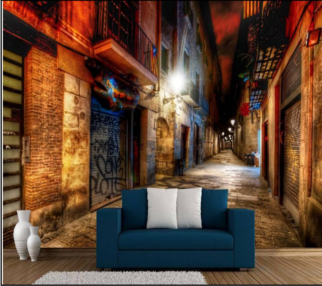
نموذج رقم (7)

نموذج رقم (7):- تم استخدام ورق جدران ثلاثي الأبعاد بنمط شرقي جديد يربط بين الحداثة والموروث الحضاري (الشناشيل).