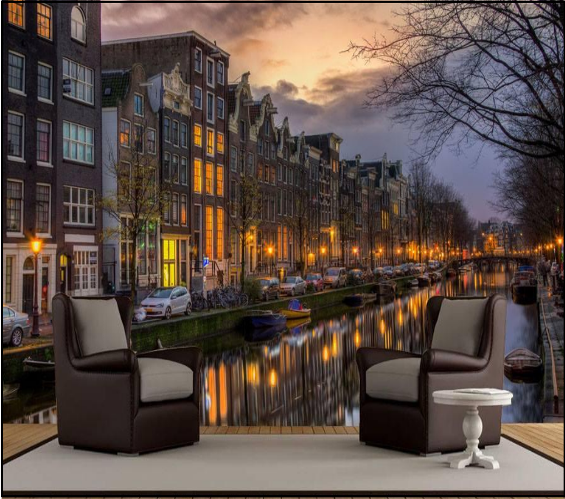
نموذج رقم (8)

نموذج رقم (8):- استخدم في هذا النموذج ورق جدران يمثل أجواء الغرب بما يحمل من جمال البناء والحداثة ، حيث يوحي هذا النموذج للمتلقي وقت غروب الشمس ( المغيب ) إضافة إلى جمال الغيوم في السماء والماء الذي ينعكس على سطحه صورة المباني و الإضاءة الذي أعطى بدوره جمال وهدوء نفسي للمتلقي ، واستخدم اللون القهوائي المتدرج واستخدم اللون البرتقالي الحار متمثل بالإضاءة التي شكلت عامل جذب للمتلقي ، وجاء لون المقاعد القهوائي ليشكل تناسقا لونها مع ألوان ورق الجدران.