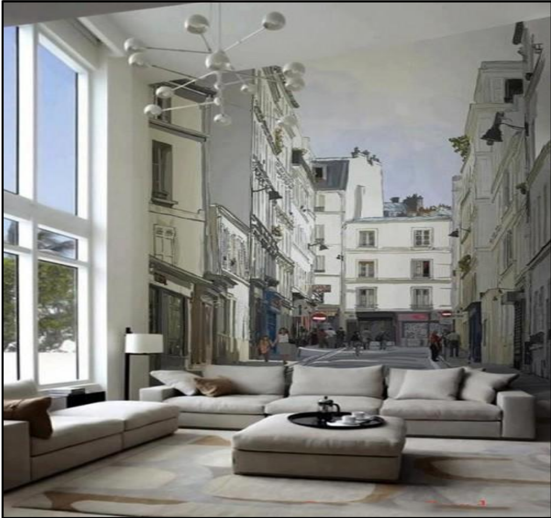
نموذج رقم (10)

نموذج رقم (10):- اتسم هذا النموذج بالغرابة نوعا ما ، حيث يوحي للمتلقي بان الأرائك موضوعة في الطريق وتعيق المارة ، واتصف بارتفاع السقف واستخدام الألوان الحيادية بكثرة حيث أعطى انطباع للمتلقي بالرتابة والملل والشعور بالغرابة ، وقد استخدمت إضاءة من نوع حديث معلقة في السقف تتصف بغرابة الشكل أيضا وقد شكلت نقطة جذب داخل هذا القضاة.