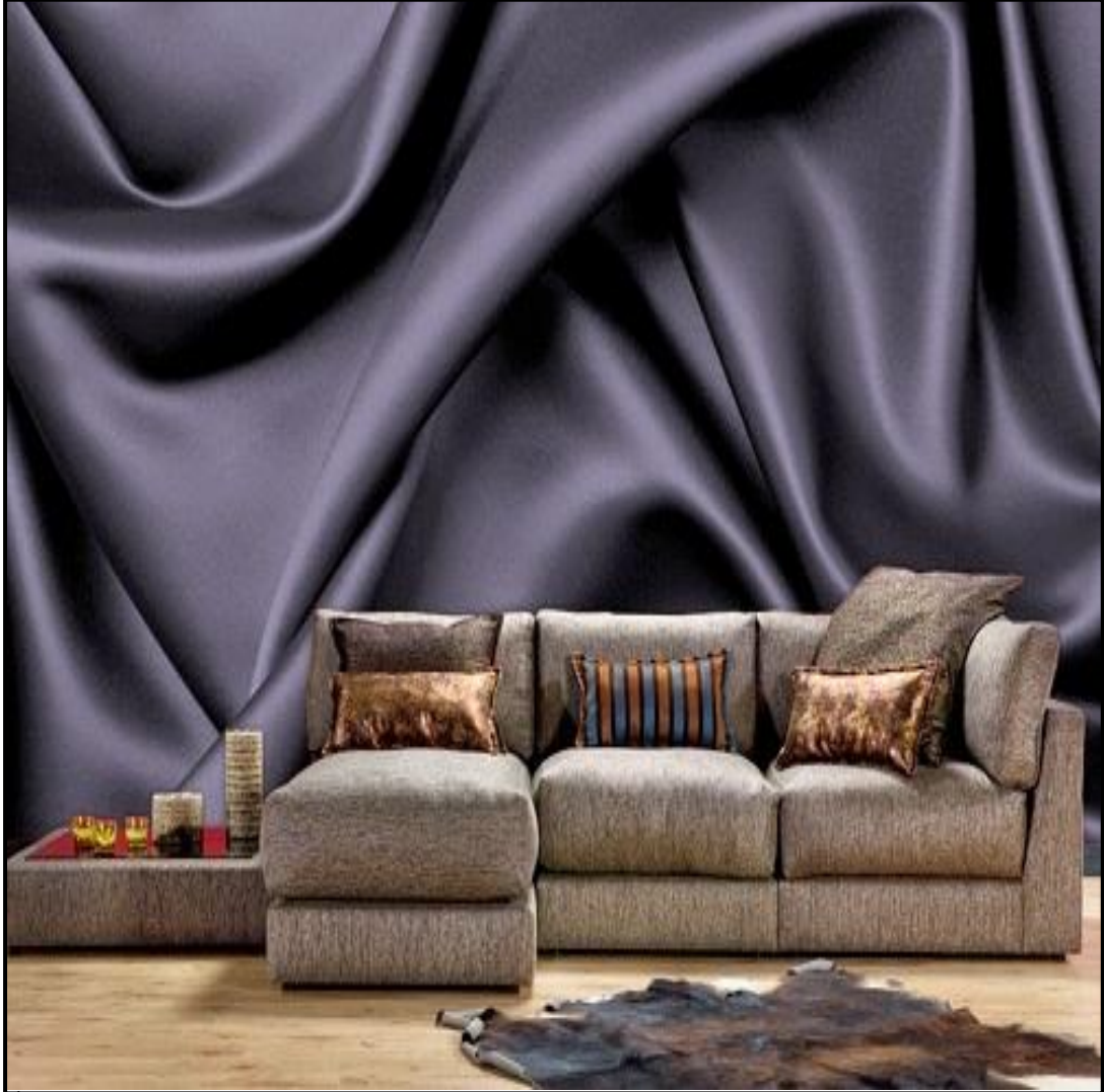
نموذج رقم (9)

نموذج رقم (9):- في هذا النموذج ورق الجدران يوحي للمتلقي باستخدام قماش من الستان الناعم الملمس وكأنه لوحة تمثل أمواج البحر الهادئة حيث لم تستخدم ألوان وتفصيل كثيرة في هذا الورق واتصفت بالبساطة والنعومة وهذه الطيات الموجودة في ثنيات القماش أعطى تدرج لوني بين العمق الغامق وبين سطح القماش الفاتح اللون وكأنه لوحة فنية متناسقة اللون والشكل رغم أن اللون المستخدم هو لون واحد ( الأزرق ) ، أما الأريكة فكانت تحمل تفاصيل دقيقة وكثيرة من حيث الخطوط والألوان المستخدمة في الوسائد إضافة إلى منضدة جانبية تكمل تفاصيل الأريكة، أما نقطة الجذب هنا تمثلت بفرش الأرضية المتمثل بجلد حيوان ( الدب ) وهي التي شدت نظر المتلقي عند النظر إليها.