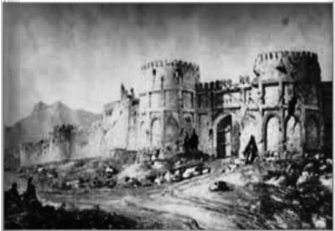
(صورة لقلعة مدينة زنجان)

أما قلعة زنجان هي من أشهر اثارها التاريخية وتضررت خلال العهود المختلفة, اذ كانت لها أهمية كبيرة من الناحية العسكرية وتوافقها مع العوائق الطبيعية الدفاعية (35) شيبت بالطين واللبد وفيها أبراج دفاعية بحدود ثلاثون برج حول المدينة, وتوجد اربعة أبراج كبيرة في الجهات الاربعة للمدينة وفيها منافذ, وداخل هذه الابراج ملجأ بعمق متران ونصف, وترتبط قلعة زنجان مع القرى والمدن المجاورة لها بواسطة ستة ابواب للدخول اليها منها بوابة قزوين, بوابة همذان (36) , وبوابة تبريز (37) وغيرها (38) ويوجد داخل سور المدينة منازل ومساجد وسوق كبير يشمل الكثير من الدكاكين والحمامات وخانات لتوقف القوافل التجارية, وكذلك يوجد فيها قصر قديم لحاكم زنجان, كان احد منازل الحكم في العهود السابقة وظلت اثاره باقية الى الان (39) . بمرور الزمن تم اعادة بناء المدينة على انقاض المدينة القديمة لأهمية موقعها على نهر زنجان, ووقوعها على الطريق التجاري القديم للمنطقة واتصالها بأذربيجان (40) ووجود مكان لمبيت القوافل الى جانب الطبيعة الطبوغرافية للمدينة, مما جعل فيها وجود اماكن رائعة وخالبة, وهذه العوامل ساعدت على بناء وتشبيد مدينة جديدة على انقاض المدينة المدمرة وعودة الحياة لها (41) .